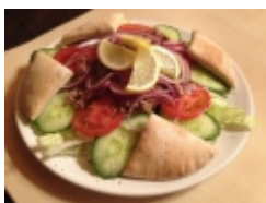
Tonhal sal ta pit ival 2 990 Ft

(j gsal ta, uborka, paradicsom, hagyma, feta sajt, olajbogy , balzsamecet, olivaolaj) [Term k r szletek...]