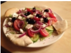
G r g sal ta pit val 3 250 Ft

Hamburgerek h zilag k sz tett h spog cs ival!